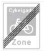
E 48 Ophør af cykelgade

Tavlen kan anvendes med undertavlerne U 1 , U 2 eller U 6 til forvarsling.