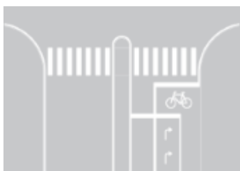
S 22 Cykelboks

Felt foran højresvingsbane i kryds, der angiver, at cyklister og førere af lille knallert kan benytte den pågældende del af vejen. V 21 cykelsymbol skal altid afmærkes i feltet.