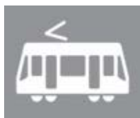
V 43 Symbol for letbanekøretøj

Felt foran højresvingsbane i kryds, der angiver, at cyklister og førere af lille knallert kan benytte den pågældende del af vejen. V 21 cykelsymbol skal altid afmærkes i feltet.