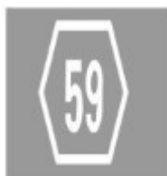
V 61 Symbol for frakørselsnummer

Symbolet i en bane, der er afgrænset af den i § 51 nævnte Q 46 Ubrudt kantlinje angiver, at banen kun må benyttes af letbanekøretøjer. Symbolet kan anvendes sammen med V 42 Bussymbol og angiver, at busser i rutekørsel må benytte banen.